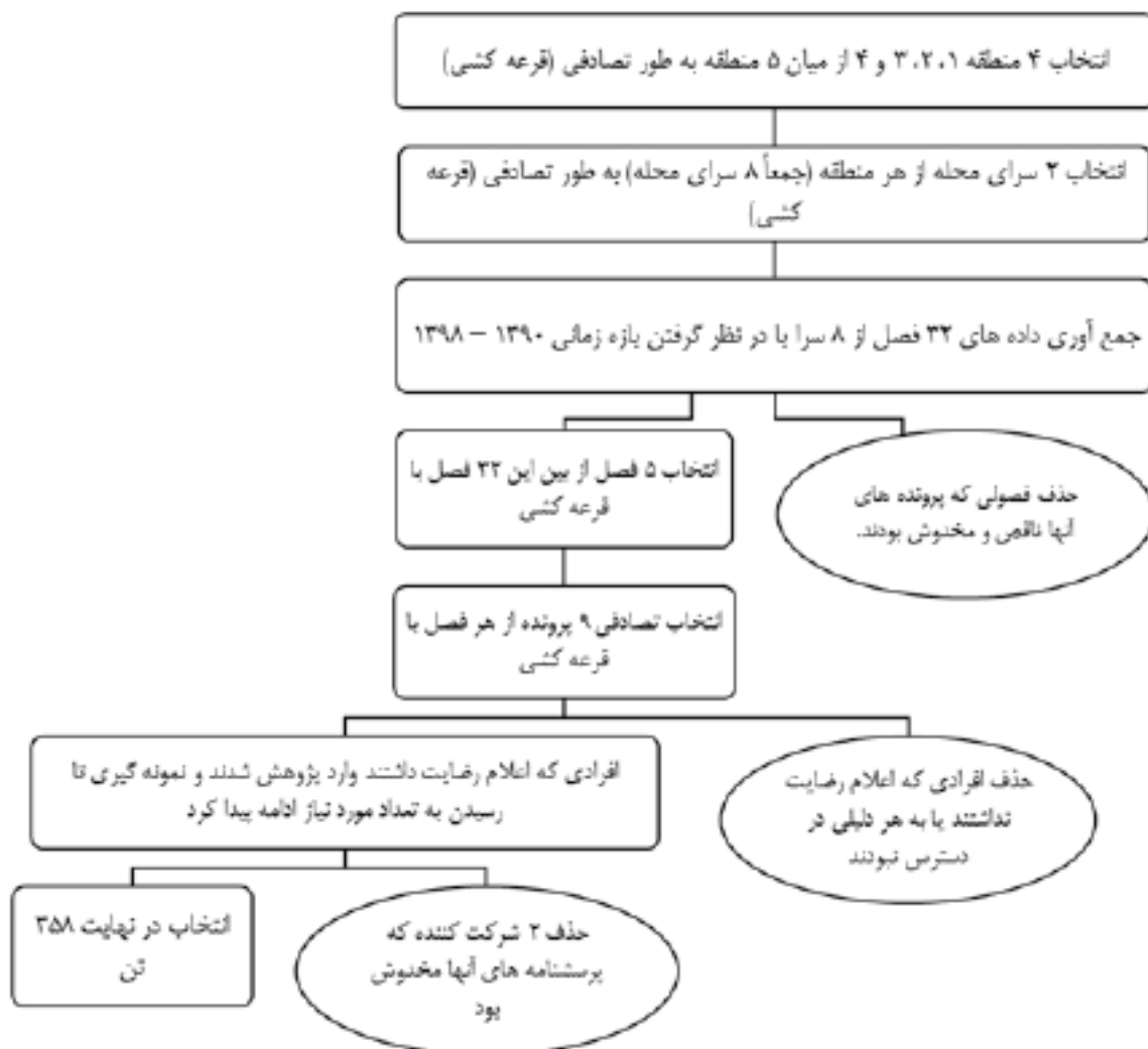
شکل ۱: فلوچارت نمونه گیری

معیارهای ورود به پژوهش شامل زنان سرپرست خانواده، عدم وجود بیماری های مزمن جسمانی و اعتیاد و دریافت دارو برای بیماری های جسمانی مزمن و خاص و داروهای روانپزشکی و روان درمانی در طول ۶ ماه گذشته بود که به صورت خودگزارشی بررسی شد، بود. معیار خروج از پژوهش شامل نقص در پاسخدهی به پرسشنامه ها، وجود بیماری های مزمن جسمانی و اعتیاد و دریافت دارو برای بیماری های جسمانی مزمن و خاص و داروهای روانپزشکی و روان درمانی در طول ۶ ماه گذشته بود. ابزارهای مورد استفاده در پژوهش حاضر به شرح زیر بود. پرسشنامه جمعیت شناختی شامل سن و دلایل سرپرستی خانوار از جمله طلاق، از دست دادن همسر و بیماری همسر بود. «پرسشنامه سلامت اجتماعی» (Social Well-Being Questionnaire) توسط Keyes در آمریکا در ایالت ویسکانسین در سال ۱۹۹۸ ساخته شده و شامل ۲۰ عبارت است که ۵ مؤلفه شکوفایی اجتماعی (social actualization) شامل ۴ عبارت از عبارت ۱ تا ۴، همبستگی اجتماعی (social integration) شامل ۳ عبارت از عبارت ۵ تا ۷، انسجام اجتماعی (social coherence) شامل ۳ عبارت از عبارت ۸ تا ۱۰، پذیرش اجتماعی (social acceptance) شامل ۵ عبارت از عبارت ۱۱ تا ۱۵، مشارکت اجتماعی (social contribution) شامل ۵ عبارت از عبارت ۱۶ تا ۲۰ را در یک طیف لیکرت ۵ درجه ای از کاملاً موافقم= ۵ تا کاملاً مخالفم= ۱ مورد ارزیابی قرار می دهد. عبارت های ۳، ۵، ۷، ۱۳، ۱۴، ۱۵، ۱۶، ۱۷، ۱۸، ۱۹، ۲۰ به صورت معکوس نمره گذاری می شوند. در این ابزار محدوده نمره از ۲۰ تا ۱۰۰ است. نمره ۲۰ تا ۴۰ بیانگر سلامت اجتماعی ضعیف،