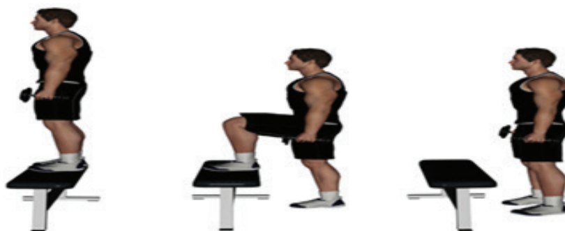
شکل ۱: آزمون پله

به منظور اطمینان بیشتر از صحت اطلاعات داده شده از آزمودنی ها، وزن بدن و قد آزمودنی ها به ترتیب با استفاده از ابزار و دستگاه های صفحه نیروسنج (Force Plate) مدل 5233A2 ساخت کمپانی کیستلر کشور سوئیس و قدسنج سیکا ۲۰۶ اندازه گیری شد. جهت کنترل ارتفاع فرود از سیستم تحلیل حرکتی وایکان شامل ۴ دوربین پرسرعت مادون قرمز سری تی استفاده گردید. این دوربین ها مارک های نصب شده بر روی بدن با مدل پلاگین گیت اندام تحتانی را شناسایی کرده و اطلاعات را جمع آوری می کنند. برای اندازه گیری نیروهای عکس العمل زمین هنگام فرود از صفحه نیرو کیستلر با فرکانس نمونه برداری ۱۰۰۰ هرتز استفاده شد. همچنین داده های کینتیکی با استفاده از فیلتر پایین گذر باترورث با برش فرکانس ۲۰ هرتز هموار گردیدند. قابل ذکر است مطالعات مختلف نشان داده اند که سیستم های تحلیل حرکت (دوربین های پرسرعت وایکان، صفحه نیرو سنج کیستلر و قدسنج سیکا) از ابزار و تجهیزات بسیار پیشرفته آزمایشگاهی در تجزیه و تحلیل حرکات می باشند که از روایی و پایایی بسیار بالایی برخوردارند و در منابع مختلف رقم روایی و پایایی ذکر نشده است (۱۹، ۲۰). در ابتدای کار مجوز از دانشگاه آزاد اسلامی واحد همدان و